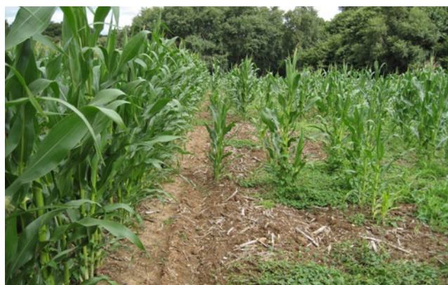
Starke Schäden durch Drahtwurmbefall in Mais