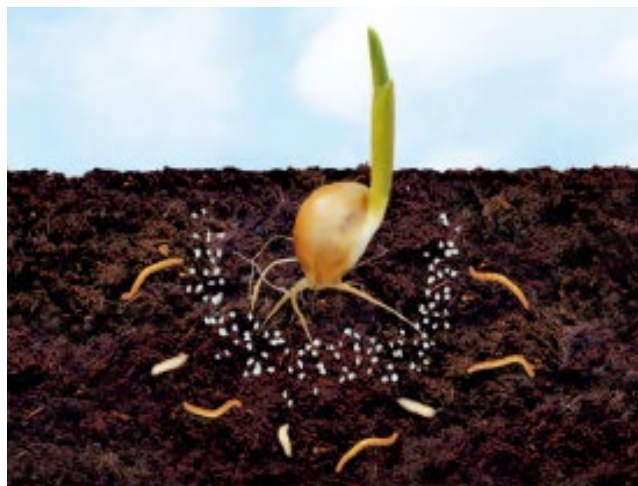
Durch Karate 0.4% GR geschütztes Maiskorn